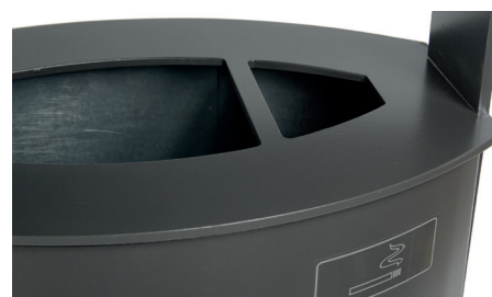
Abb.: 7093-30 in DB 703 Ascherdetail