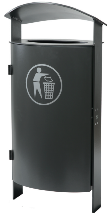
Abb.: 7093-20 in DB 703