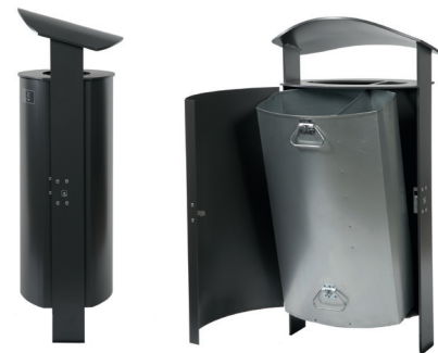
Abb.: 7093-20 in DB 703 Seitenansicht