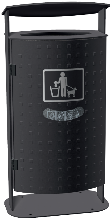
Abb.: 7092-84 in RAL 7021 Feinstruktur