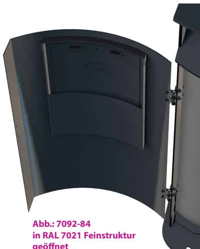
Abb.: 7092-84 in RAL 7021 Feinstruktur geöffnet