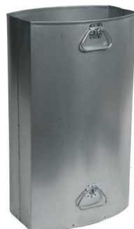
Abb.: Einsatzbehälter für Version 7092-40/60