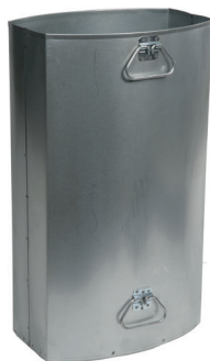
Abb.: Einsatzbehälter für Version 7092-40/60