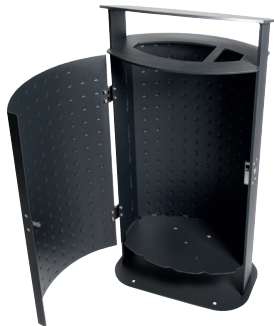
Abb.: 7092-50 in RAL 7021 Feinstruktur Version 7092-40/60 geöffnet