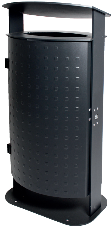
Abb.: 7092-40 in RAL 7021 Feinstruktur