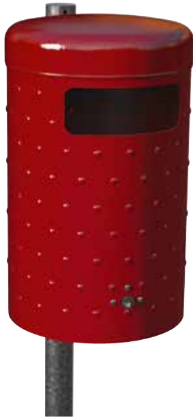
Abb.: 7022-20 in RAL 3002 (Sonderfarbe) mit Pfosten 7200-03 FV