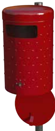
Abb.: 7022-20 in RAL 3002 (Sonderfarbe) geöffnet