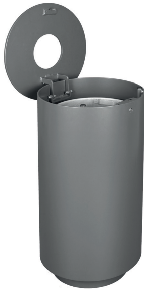
Abb.: 7097-00 in DB 703 geöffnet