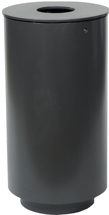
Abb.: 7097-00 in DB 703