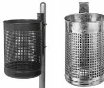
Abb.: 7013-00 in RAL 7016 an Pfosten 7200-04 FV