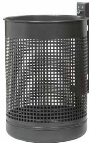
Abb.: 7013-00 in RAL 7016