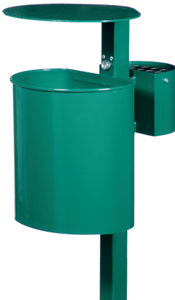
Abb.: 7079-01 in RAL 6005