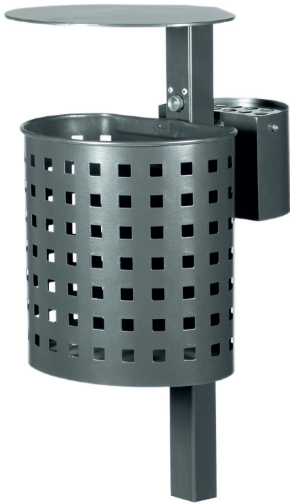
Abb.: 7079-00 in DB 703