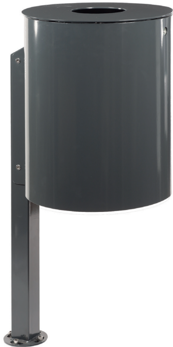
Abb.: 7039-50 in RAL 7016