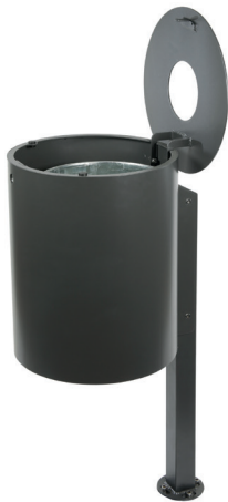
Abb.: 7039-50 in RAL 7016 geöffnet