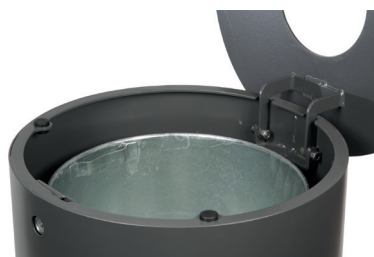
Detail Deckelscharnier und Einsatzbehälter