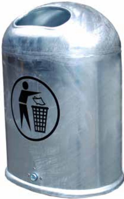
Abb.: 7035-00 feuerverzinkt mit Aufkleber 8310-00 (optional)