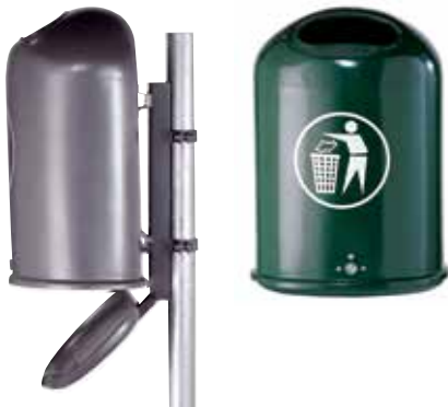
Abb.: 7035-00 in DB 703 Bodenklappe geöffnet